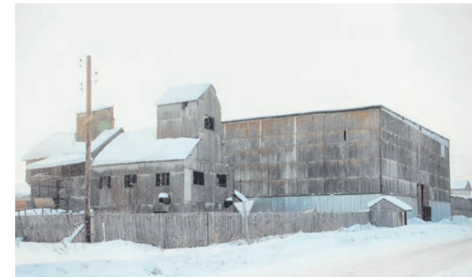
● Вероятно, многие люди, не знакомые с инфраструктурой Новодмитриевки, задавались логичным вопросом: как называется эта странная конструкция в селе, установленная рядом с трассой? На самом деле это – зерноочистительный-сушильный комплекс КЗС-10-2Б (пронусная способность – 10 тонн в час, двухбаранный) с модулем. Комплекс действующий, в период уборки урожая на нём сортируют зерно, а при необходимости – ещё и сушат