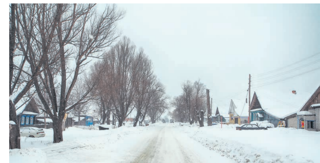
● Село Новодмитриевка, улица Песчаная, вид со стороны главной дороги. Съёмка – февраль 2017 г.