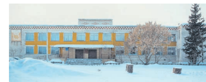
● Новодмитриевский Дом творчества открыт в 1979 году и в настоящее время в его стенах работает библиотека с архивом на 14 000 книг, ретепирует хор «Россианка», проводятся занятия в детском вокальном кружке. А ещё в местном клубе проходит традиционный летний фестиваль эстрадных групп. В этом ежегодном концерте принимают участие ансамбли из близлежащих районов; география участников весьма широка: Выкусы, Ваца, Павлово, Арзамас и др.