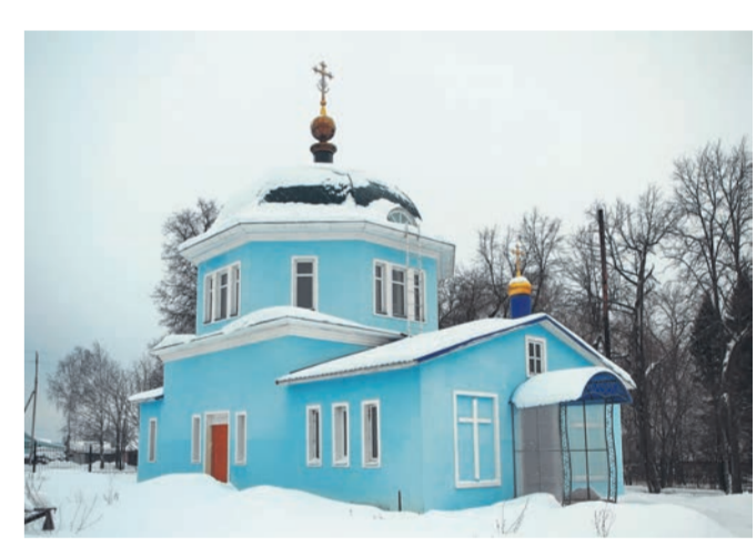
● Новодмитриевская церковь Покрова Пресвятой Богородицы построена в 2005 году, но сама история возведения местного храма весьма примечательна. Первая деревянная церковь в селе была построена в 1867 году, но в середине 60-х годов прошлого века её уничтожил пожар. На месте старого храма был возведён клуб, однако через несколько лет он тоже сгорел. Клубное помещение отстроили заново, но после распада СССР грянули новые времена, и на строения в обществе постепенно менялись. После народного съезда в 2000-м году было решено на месте бывшего новодмитриевского клуба возвести новую церковь, строительство которой началось в 2002-м и закончено три года спустя