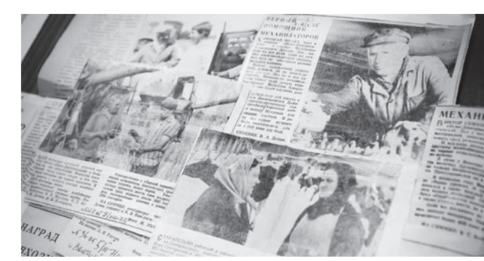
● В сельской библиотеке хранятся статьи разных лет из газеты «Выкунский рабочий» о жизни Новодмитриевки и местных колхозных тружениках. Большая часть этих публикаций приходится на 1970-е годы – поистине золотое время для советских сёл и деревень!