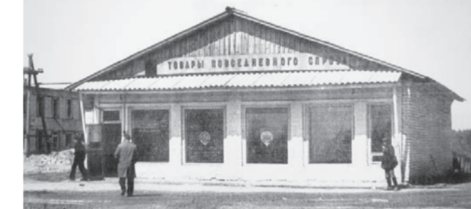
● Эпизод из жизни села: так выглядел новодмитриевский магазин «Товары повседневногo спроса» на рубеже 1970-1980-х